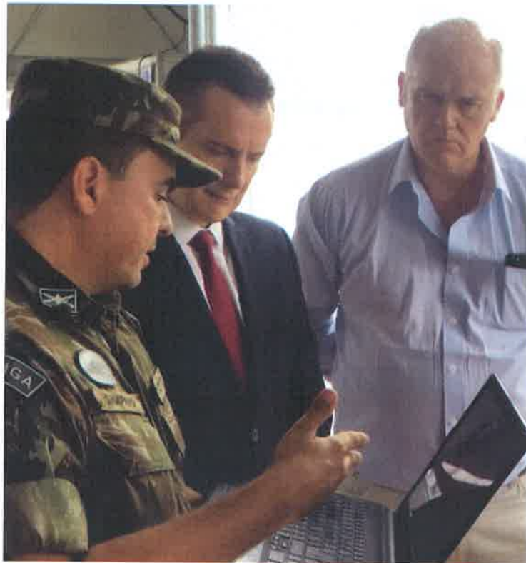
FOTO 7 - Visita al Puesto de Clasificación (P-TRIG) en Boa Vista.