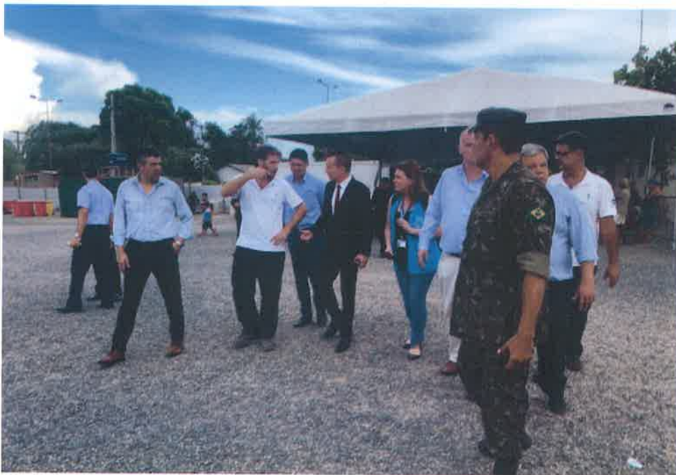
FOTO 8 - Visita al Alojamiento Rondon I en Boa Vista, recepción por el Ejército