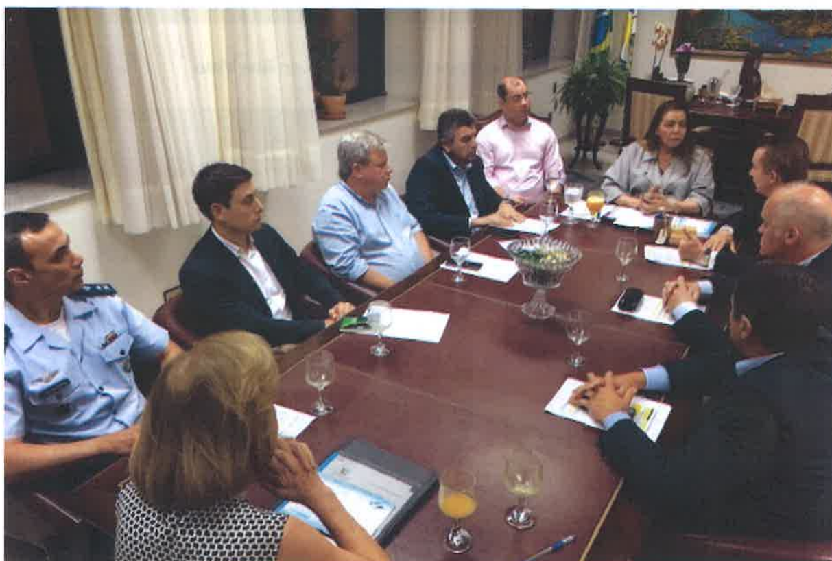
FOTO 12 - Reunión con la Gobernadora del Estado de Roraima, Sra. Suely Campos.