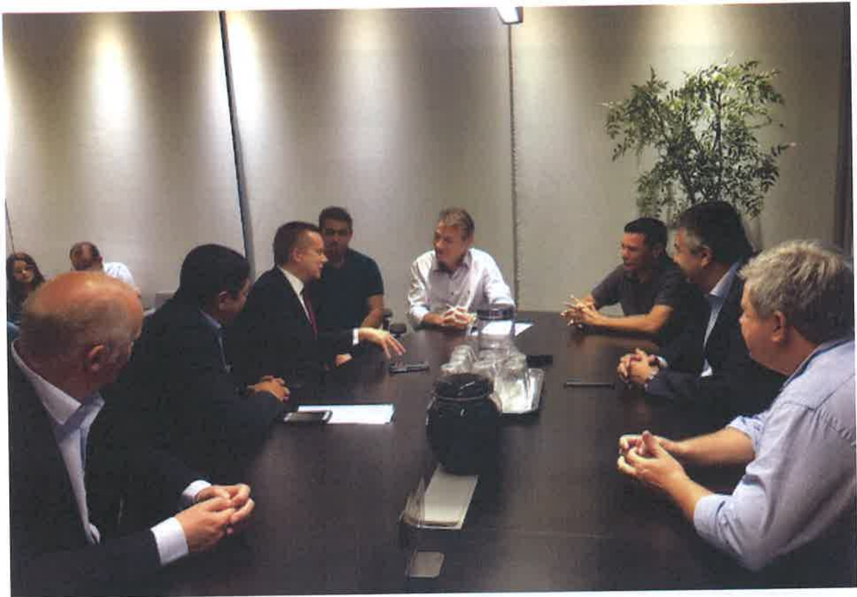
FOTO 13 - Reunión con el gobernador electo. del Estado de Roraima, Sr. Antonio Denarium.