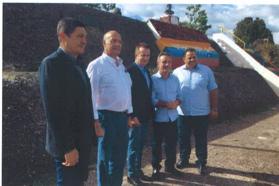
FOTO 19 - Visita a Pacaraima.