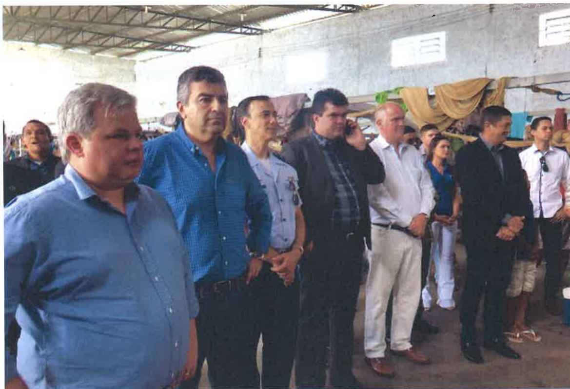
FOTO 17 - Visita al Alojamiento Janokoida en Pacaraima.