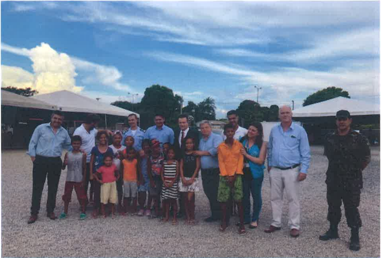
FOTO 9 - Visita al Alojamiento Rondon I en Boa Vista