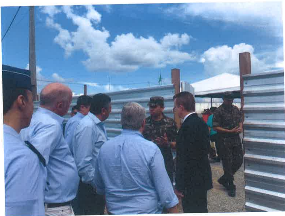
FOTO 2 - Recepción por el Ejército en el Puesto de Clasificación (P-TRIG) en Boa Vista