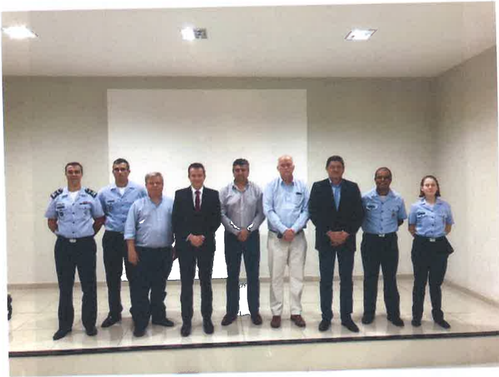
FOTO 1 - Recepción por la Fuerza Aérea Brasileña en la ciudad de Boa Vista