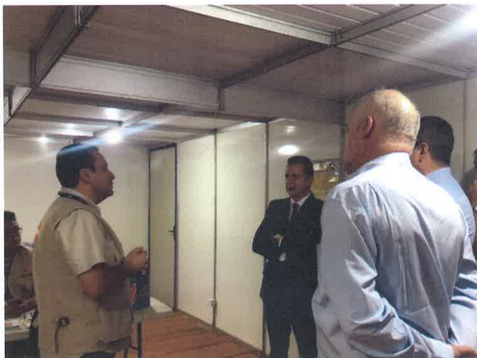
FOTO 6 - Visita al Puesto de Clasificación (P-TRIG) en Boa Vista, recepción por representantes de UNFPDA