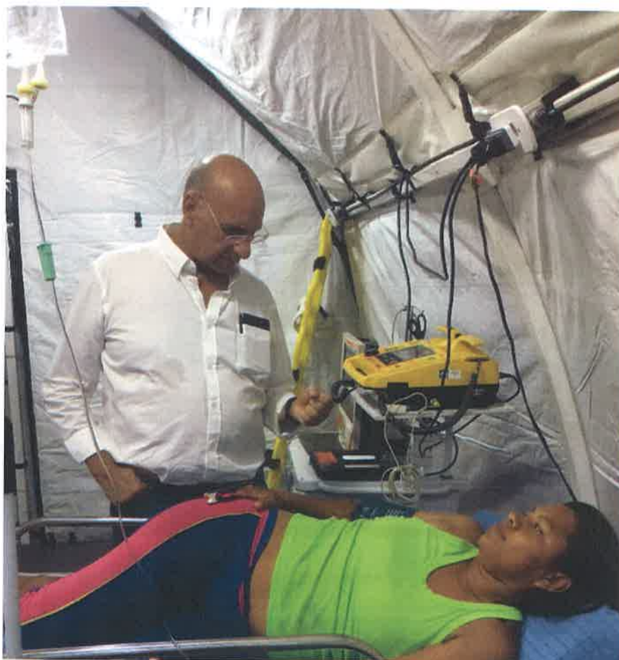
FOTO 18 - Visita al Alojamiento BV - 8 en Pacaraima.