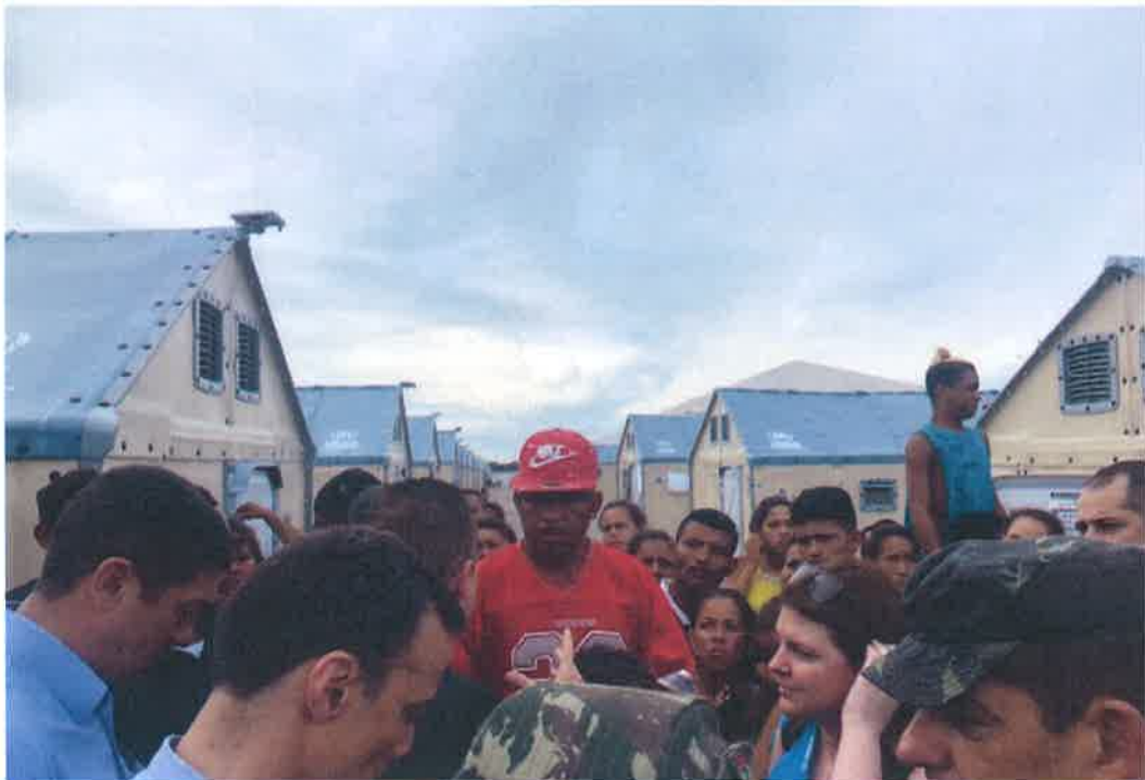
FOTO 10 - Visita al Alojamiento Rondon I en Boa Vista