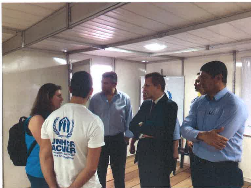
FOTO 5 - Visita al Puesto de Clasificación (P-TRIG) en Boa Vista, recepción por representantes de ACNUR