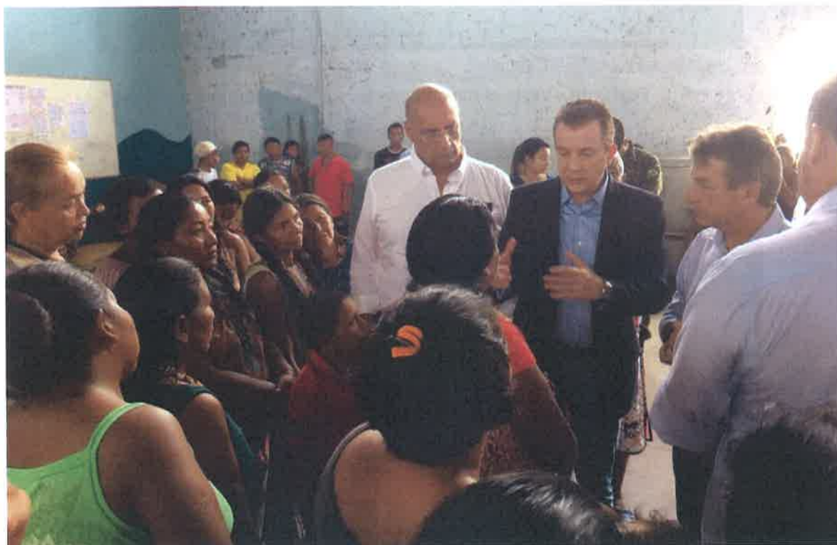
FOTO 18 - Visita al Alojamiento Janokoida en Pacaraima.