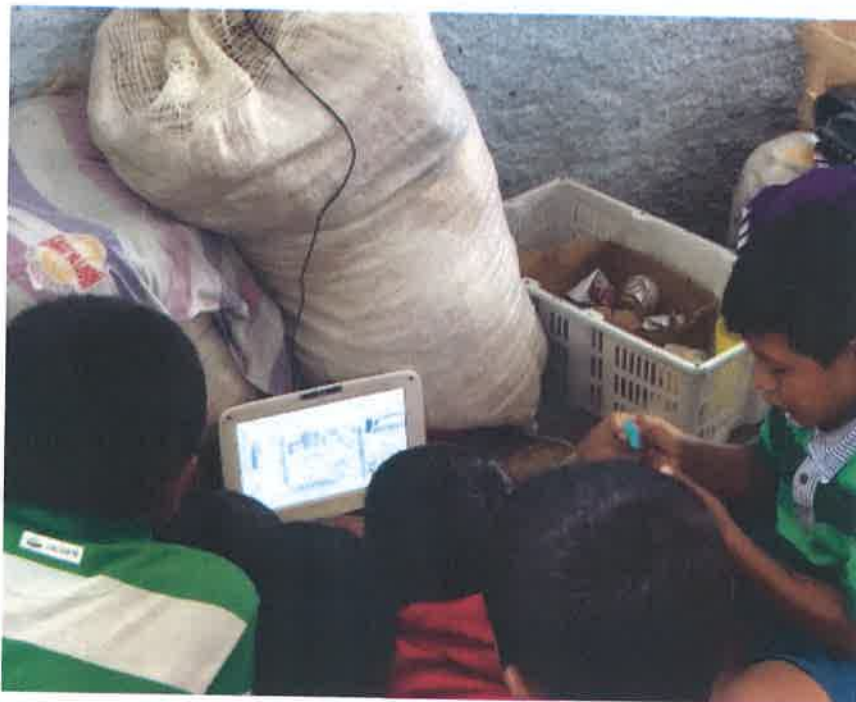
FOTO 16 - Visita al Alojamiento Janokoida en Pacaraima.