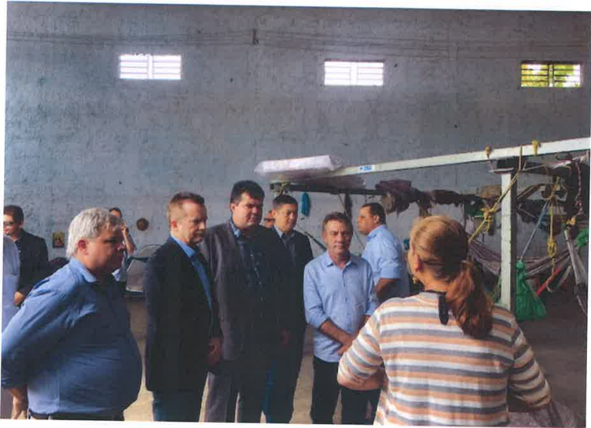
FOTO 15 - Visita al Alojamiento Janokoida en Pacaraima.